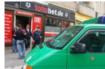
Razzia Polizei durchsucht Wettbüros nach illegalen Spielautomaten