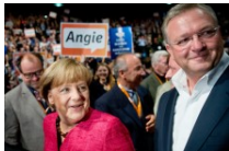
Nach der Wahl Henkel warnt SPD und Grüne vor einem "Eigentor"