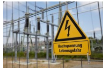
Stromnetz Streit übers Stadtwerk eskaliert im Berliner Senat