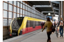
Ausschreibung So sollen die neuen S-Bahn-Züge für den Ring aussehen